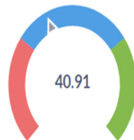
(%) Pessoas cadastradas que emitira...